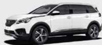
Белый Bianca White («неметаллик»)*