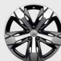
18-дюймовые легкосплавные колесные диски CHICAGO*, двухцветные со специальной обработкой поверхности для получения глянцевого покрытия