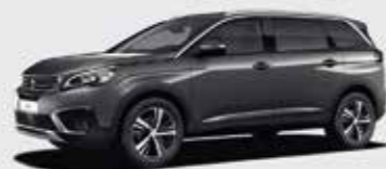
Серый Amazonite Grey («металлик»)**