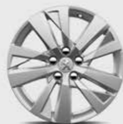
17-дюймовые легкосплавные колесные диски CHICAGO*

Новый кроссовер PEUGEOT 5008 оборудован изящными дисками, доступными в различных вариациях. Подчеркните стиль и внешний вид вашего нового автомобиля!