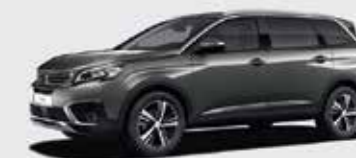
Серый Nimbus Grey («металлик»)**