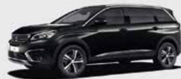
Черный Nera Black («металлик»)**