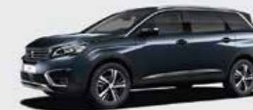
Синий Egyptian Blue («металлик»)**