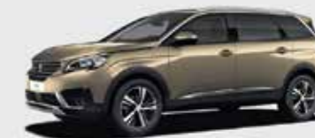
Бежевый Biege Pyrite («металлик»)**