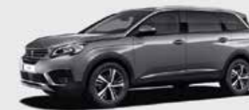
Серый Cumulus Grey («металлик»)**