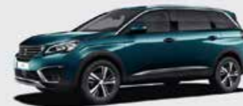
Изумрудный Emerald Crystal («металлик»)**