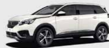
Белый перламутровый Pearlescent White**